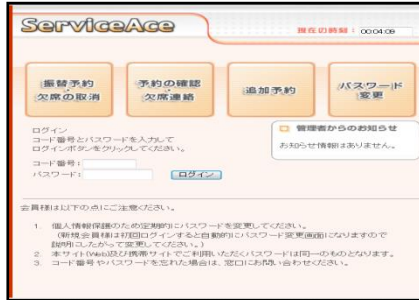
↑ パソコンログイン画面

レッスンの欠席・振替予約・追加予約を24時間インターネット や携帯電話からお手続きできるシステムを導しております